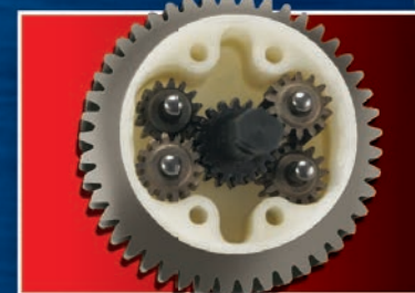
Planetary Differential Différentiel planétaire Diferencial de engranajes planetarios Kegelraddifferential