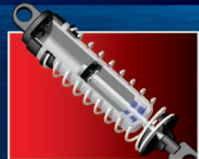
Oil-Filled Ultra Shocks™ Ultra Shocks™ remplis d'huile Ultra Shocks™ de aceite Ultra Shocks™ Öldruckstoßdämpfer

Whether you're crushing your buddies' cars, catching big air, or laying down monster wheelies, Stampede just doesn't know when to quit. It's tall, drive-over-anything ground clearance and ultra-tough suspension make Stampede feel nearly indestructible. Being big is good, but being big AND fast is even better! When it comes to speed, Stampede's Titan 12-turn modified motor and racing-style transmission deliver a 1-2 knockout punch to the competition. No other truck offers Stampede's unique style, capability, and reputation for durability. It's a proven favorite with a formula for fun that nothing else can touch. Stampede is perfect for almost any age driver or skill level. The XL-5 electronic speed control can be programmed to run at 50% maximum throttle (Training Mode™), giving new drivers a chance to try out their skills before unleashing full-throttle monster power.