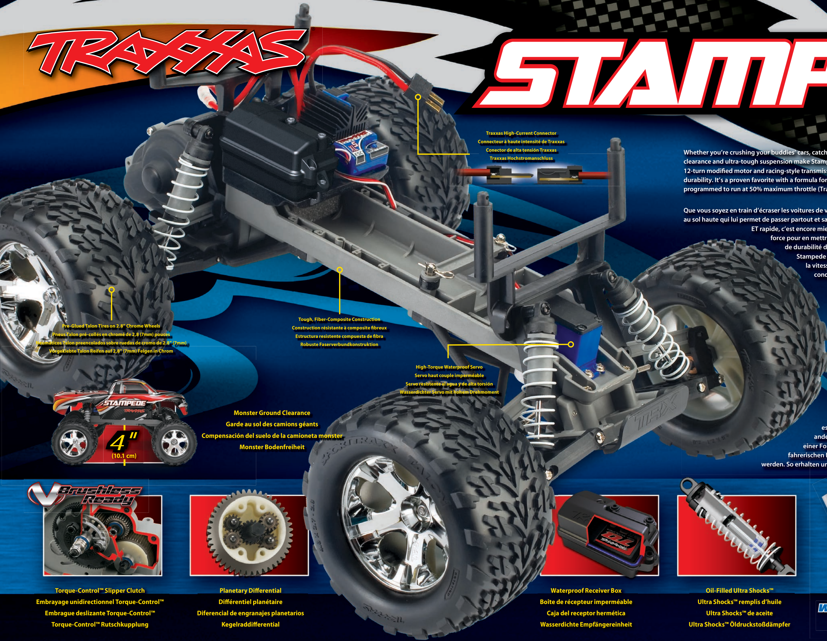
Traxxas High-Current Connector Connecteur à haute intensité de Traxxas Conector de alta tensión Traxxas Traxxas Hochstromanschluss