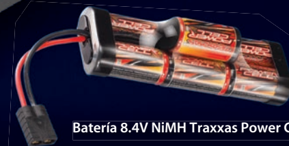
Batería 8.4V NiMH Traxxas Power Cell