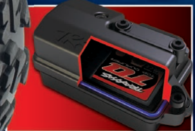
Waterproof Receiver Box Boîte de récepteur imperméable Caja del receptor hermética Wasserdichte Empfängereinheit