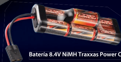
Batería 8.4V NiMH Traxxas Power Cell