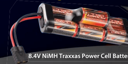
8.4V NiMH Traxxas Power Cell Batterie