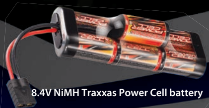
8.4V NiMH Traxxas Power Cell battery