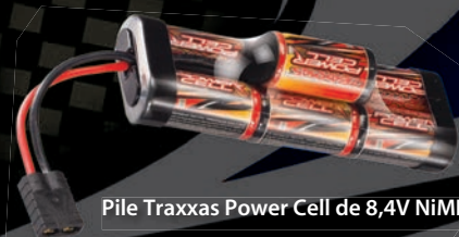
Pile Traxxas Power Cell de 8,4V NiMH