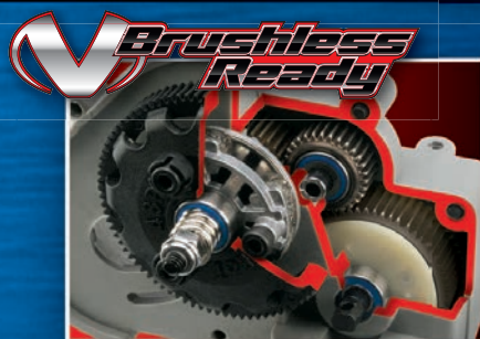
Torque-Control™ Slipper Clutch Embrayage unidirectionnel Torque-Control™ Embrague deslizante Torque-Control™ Torque-Control™ Rutschkupplung