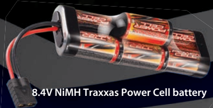
8.4V NiMH Traxxas Power Cell battery