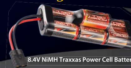
8.4V NiMH Traxxas Power Cell Batterie