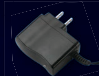
Cargador Gratis Incluido