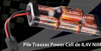
Pile Traxxas Power Cell de 8,4V NiMH