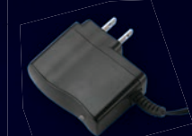
Cargador Gratis Incluido