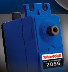
High-Torque Digital Steering Servo