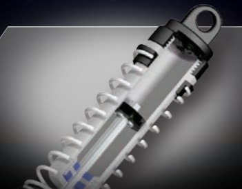
Oil-Filled Ultra Shocks™