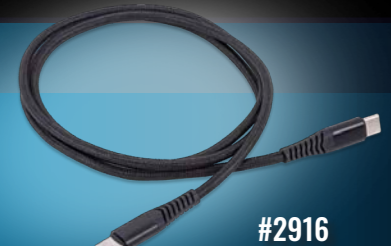
High-Output USB-C Power Cable