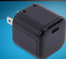
45-Watt USB-C AC Power Adapter