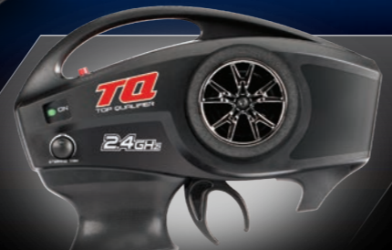
TQ™ 2.4GHz Radio System