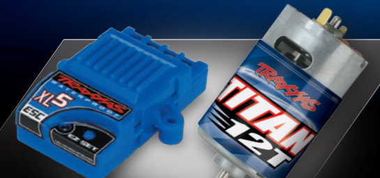
XL-5™ Electronic Speed Control and Titan® 12T 550 Motor