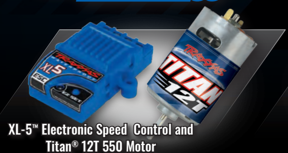
XL-5™ Electronic Speed Control and Titan® 12T 550 Motor