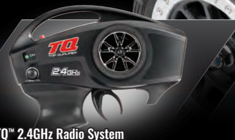
TQ™ 2.4GHz Radio System