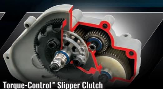
Torque-Control™ Slipper Clutch