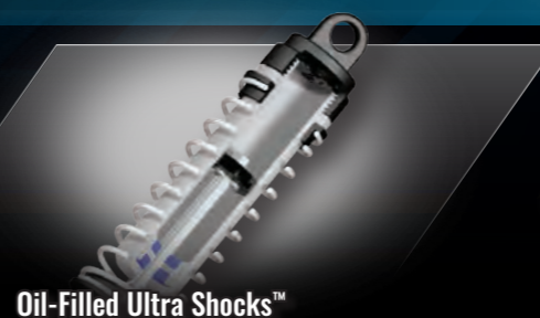
Oil-Filled Ultra Shocks™